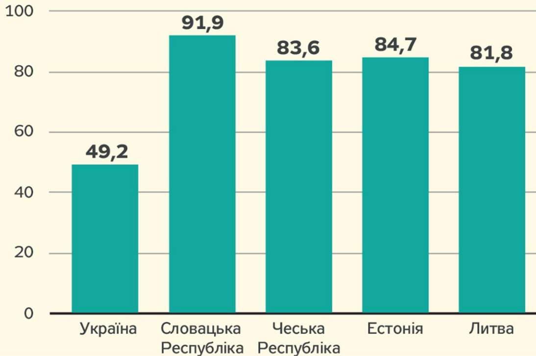
Рис.1. Частка експорту товарів і послуг у ВВП країн у 2014 р. %

Питання полягає в тому, як перетворити цей потенціал на ресурс розвитку. Відповідь доволі проста: необхідно вивчати інструменти підтримки експортерів, що використовуються у цих країнах, і намагатися впроваджувати найліпші практики у себе, звісно, з урахуванням стану української економіки, нашого географічного положення, природного середовища та культурної спадщини.