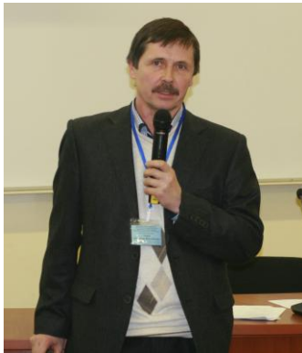
Відповідальний секретар – О.М. Гладун, д-р екон. наук, заст. директора Інституту демографії та соціальних досліджень ім. М.В. Птухи НАН України

Науково-видавнича рада НАН України вітає колектив редакції і редакційну колегію журналу "Демографія та соціальна економіка" з першим ювілеєм та зичить доброго здоров'я, щастя, плідної роботи, нових творчих здобутків та подальших успіхів у підготовці важливого для української науки видання.