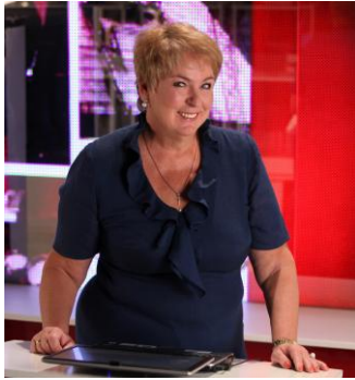
Голова редакційної колегії – Е.М. Лібанова, акад. НАН України, д-р екон. наук, проф., директор Інституту демографії та соціальних досліджень ім. М.В. Птухи НАН України